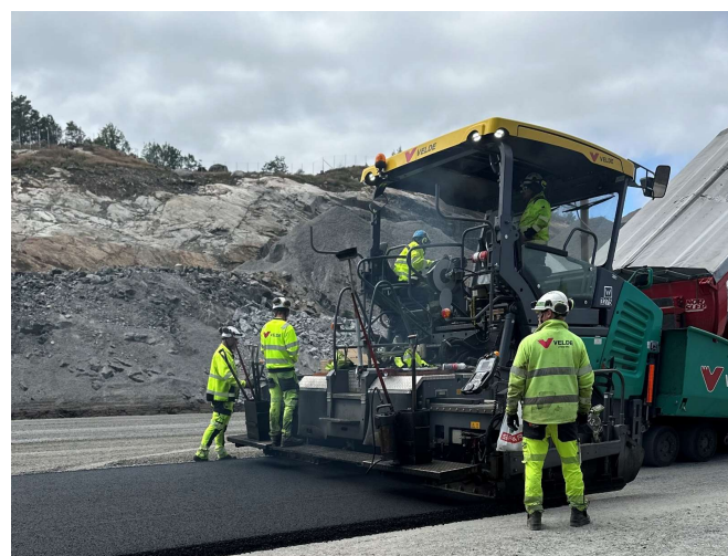
Illustrasjon: Eramet Norway